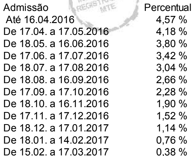
TABELA DE PROPORCIONALIDADE 4,57%

04.2. As diferenças remuneratórias decorrentes do estabelecido nesta convenção, relativamente ao mês de abril 2017, poderá ser satisfeitas até 10 de junho 2017.